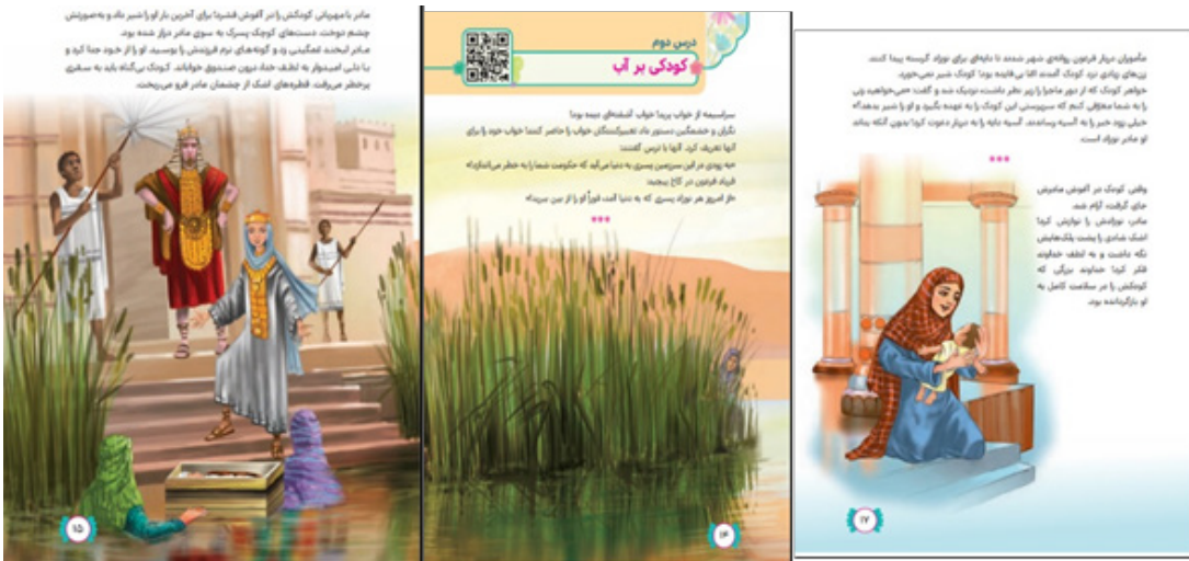
تصویر (۲). تصویرسازی درس دوم هدیه های آسمان چهارم ابتدایی

خلاصه متن: مادر موسی برای حفظ جان فرزندش از دست فرعون او را در صندوقچه ای می گذارد و به آب می سپارد. جریان رودخانه صندوقچه را به نزدیک کاخ فرعون میبرد. کودک با لطف الهی نجات پیدا میکند.