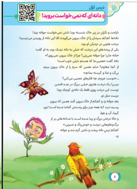
تصویر (۱). تصویرسازی درس اول هدیه‌های آسمان چهارم ابتدایی (سازمان تألیف و تدوین کتب درسی، ۱۴۰۲)