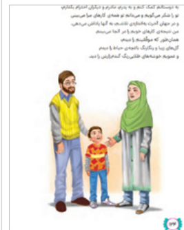
تصویر (۴). تصویرسازی درس نوزدهم کتاب هدیه‌های آسمانی پایه چهارم

قدری احساس شکرگزاری دیده می‌شود، اما در کل آنچه نیاز عاطفی این تصاویر است آن است که ظرفیت بیشتری از احساسات انسانی نسبت به همدیگر و نسبت به خداوند بروز و ظهور داشته باشد تا تصویر زنده و جاندار به نظر برسد و احساسات اشخاص قصه را که بسیار تعیین کننده است بنمایاند.