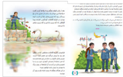
تصویر (۳). تصویرسازی درس هجدهم هدیه های آسمان چهارم ابتدایی چشمان همیشه بازش

سبک و اجرا: سبک متن اگرچه واقع‌گراست، اما وجوه نشانهای هم در آن به چشم می‌خورد. سبک تصویر، کاملاً، واقع‌گرایانه با کمی گرایش به طنز و ساده‌سازی است. تلاش برای چند وجهی نمودن سبک تصویر در راستای بیان معنای نهفته در قضا برغناهی تصویری آن می‌افزود. گرایش به ذهنیت‌گرایی می‌توانست تفکر برانگیزی و معناسازی را در تصویر افزایش دهد. به تصویر کشیدن ماهیت اعمالی که موجب آزار پزندگان می‌توانست پیام متن را بهتر منتقل نماید. ترکیب‌بندی و زاویه دید معمولی و از روبرو است و عمق میدان چندانی به چشم نمی‌خورد. تنوع زاویه دید، ترکیب‌بندی پویاتر بر تحرک و جنبش تصویر می‌افزود.