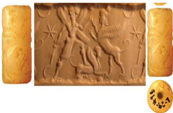
شکل ۱۰- عصای داسی شکل در دست شاه اساطیری در دوره آشور نو (Niederreiter, 2020, p.110, fig 6)

در آشور نو عصای داسی شکل در دست شاه اسطوره‌ای (انسان بالدار) به نمایش درآمده که نشان دهنده قدرت ماورایی از جانب خدایان و سلاحی برای مبارزه با شیاطین و نیروهای خبیث در طبیعت است (کوپر، ۱۳۹۲، ص. ۲۷۸) (شکل ۱۰). در دوره بابل نو نیز عصای داسی شکل در دست شاه مشاهده می‌شود (شکل ۱۱).