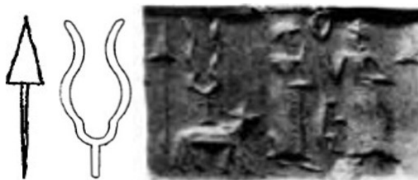
شکل ۱۹- نماد نیزه، آذرخش دوشاخه در مهر آشوری (William and Moore, 1940, p. XI, fig 99)

ون بورن معتقد است عصا و حلقه نشانه قدرت الهی است و سلطنت (Ven Buren, 1949, p. 450) و فرانکفورت و اسلانسکی عصا و حلقه را نماد مرگ‌ومیر و زندگی ابدی می‌دانند و اگر با هم نشان داده بشوند نماد زمان و ابدیت است (Frankfort, 1939, p. 179; Slanski, 2007, p. 41, 51). در دوره آشور نو حلقه و عصا در دست شاه آشور مشاهده می‌شود. از آنجایی‌که دایره آغاز و پایان آن مشخص نیست می‌توان آن را نماد زمان در نظر گرفت و در دست خدایان می‌تواند نشان‌دهنده زمان لایتنهای باشد (شوالیه و گریبان، ۱۳۸۵، ص. ۱۹۷). در لوح چهارم آنومالیش در سطرهای ۲ تا ۲۸ به توصیف مردوک پرداخته که برای نابودی تیامات و بازگردان یک صورت فلکی تلاش می‌کند و خدایان به او عصا، حلقه و تخت می‌بخشند که می‌تواند نشان جاودانگی باشد (Langdon: 1923, p. 397)؛ بنابراین یکی از نمادهای مردوک در دوره بابل قدیم عصا و حلقه است. در دوره آشور با قدرت گرفتن خدای آشور، مردوک با نماد نیزه کوتاه نشان داده می‌شود (شکل ۱۹)، احتمالاً این همان نمادی است که گاهی اوقات نام آشوری (مارو) را نشان می‌دهد و با نام بیل یا پیکان معرفی شده است (بلک و گرین، ۱۳۸۵، ص. ۲۷۹). از نظر نمادشناسی پیکان مثلث سر بالا مظهر زندگی و نماد سه‌گانه جهان، آسمان و زمین است (کوپر، ۱۳۹۲، ص. ۲۲۲). در مهر استوانه‌ای ذیل از دوره آشوری در سمت راست زن و مردی مشاهده می‌شوند و در سمت چپ پشت سر مرد نماد آذرخش دوشاخه بر روی گاو (نماد اداد) و پیکان مثلثی شکل مشاهده می‌شود.