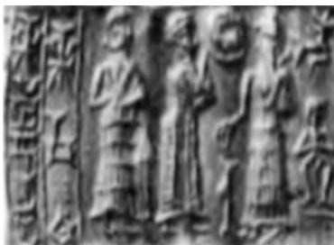
شکل ۱۷. حلقه در دست مردوک، مهرهای بابل قدیم

در دوره بابل قدیم حلقه و عصا در دست شمش مشاهده می‌شود که به حمورابی اهدا می‌کند که نماد عدالت به شمار می‌رود. همچنین حلقه در دوره بابل قدیم در دست مردوک نیز دیده می‌شود. در شکل ذیل در سمت راست صحنه مردوک با لباس کائولیس و کلاه شاخ‌دار بر سر مشاهده می‌شود که در دست راست خود حلقه‌ای را گرفته و بر روی یک ایزدشیر ایستاده است در مقابل او دو نفر ایستاده‌اند که نفر اول کلاه گردی بر سر و لباس بلندی بر تن دارد و پشت سر آن ایزد دیگری مشاهده می‌شود، بالای صحنه نماد خورشید و ماه قرار گرفته است (شکل ۱۷). حلقه نماد اقتدار است و اغلب با یک عصا یا عصای کوتاهی همراه است، این نماد به ایزد خاصی تعلق ندارد و در دست ایزدان و ایزد بانوان مشاهده می‌شود.