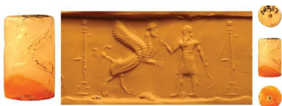
شکل ۱۱. عصای داسی شکل در دست نبوکدنصر، بابل جدید (Niederreiter, 2020, p.183)

از دوران کاسی در برخی از نمونه‌ها، زن برهنه‌ای به تصویر کشیده شده که هیچ نمادی در دست ندارد ولی در مهرهای استوانه‌ای آشور نو دوباره شاهد نمایش زنی هستیم که لباس بلند چاک‌داری بر تن و کلاه استوانه‌ای بر سر دارد که بالای سر آن ستاره هشت‌پر و در دستش حلقه‌ای از سنگ مشاهده می‌شود که شبیه تسبیح و در برخی از مهرها دورتادور او را حلقه‌ای از ستاره در برگرفته است. همچنین در بالای سر او هفت کره کوچک به‌طور مکرر در فضای مهرها دیده می‌شود که صور فلکی را نشان می‌دهند و از نظر ستاره‌شناسی با گروه ستاره‌های هفت خاوه‌ر در ارتباطند و یا نشان دهنده هفت خدا است (بلک و گرین، ۱۳۸۵، ص. ۲۶۵) (شکل ۱۲). منشأ هفت خدا به همراه خواهرشان نرودو، احتمالاً، عیلامی است و با الهه نرونته مرتبط می‌باشند (بلک و گرین، ۱۳۸۵، ص. ۲۶۹).