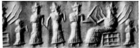
شکل ۱۴. ایزد شمش با پرتو و عصا کوتاه در دست، مهر استوانه‌ای دوره اکدی

«شمش» ایزد خورشید که وظیفه او قضاوت و عدالت است و در دوره سومر تا اکد بانام «اوتو» شناخته می‌شود، برادر اینانا و پسر نانا (ماه) بوده که در دوره سومر با کمان نشان داده می‌شود (Shaked, 1980, p. 14) و در مهرهای استوانه‌ای دوره اکد تا بابل قدیم با پرتوهای نور در پشتش و عصای کوتاه در دستش شناخته می‌شود. در شکل ذیل شمش با لباس چین‌دار و کلاه شاخ‌دار بر سر بر روی صندلی نشسته و در پشت او پرتوهایی مشاهده می‌شود و در دست خود عصا کوتاهی را نگه داشته است (شکل ۱۴).