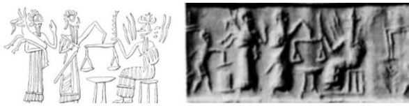
شکل ۱۵. ترازو در مقابل ایزد شمش، مهر استوانه‌ای دوره اکد

از او قرار دارد، قربانی کند (شکل ۱۵). این مهر منحصر به فرد است؛ بنابراین مهر می‌توان گفت یکی از وظایف ایزد شمش قضاوت و برقراری عدالت بوده است؛ شاید بتوانیم با توجه به این مهر بگوییم شمش در دست شمش عصا یا سلاح نیست و احتمالاً قلم باشد.