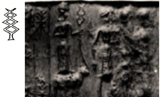
شکل ۱۳. آذرخش دوشاخه نماد خدای اد در مهرهای بابل قدیم

عصای دیگر مشاهده شده در مهرهای استوانه‌ای دوره بابل قدیم عصای صاعقه‌ای شکل است که به «آذرخش» معروف است و نماد «اد» خدای آب و هوا است که دو سر دارد و حیوان آن گاو است (شکل ۱۳).