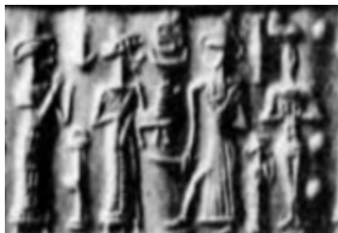
شکل ۱۸. ایزد شمش بدون پرتو با قلمی در دست (William and Moore, 1940, p. XI, fig 45)

است و شناسایی او از طریق عصا و یا اره در دستش است. در این دوره شمش عصا و یا قلمی را حمل می‌کند درحالی‌که پای خود را بر روی یک سکو کم ارتفاع و کوچکی گذاشته که احتمالاً نماد کوه است (شکل ۱۸).