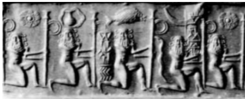
شکل ۷. عصا با سر گوه‌ای شکل در دست گیلگمش در مهرهای اکدی (William and Moore, 1940, p. V, Fig 36)