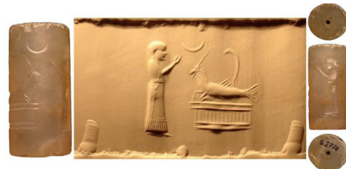
شکل ۵. عصای سرکچ در بالای حیوان ترکیبی به شکل بزماهی،

این عصا بر روی مهرهای آشوری و بابل نو در کنار یک بزماهی آمده است که یک کاهن در روبروی او در حالت عبادت مشاهده می‌شود (شکل ۵)، از آنجایی که خدای آب‌ها «انکی» است موجودات وابسته به آب نیز به او مرتبط می‌شوند، از این رو می‌توان این عصای سرکچ را متعلق به انکی بدانیم (بلک و گرین، ۱۳۸۵، ص. ۹۵)؛ بنابراین می‌توان بیان کرد این نقش مایه مختص یک ایزد خاص نیست و می‌تواند در دست و یا کنار هر ایزدی قرار بگیرد.