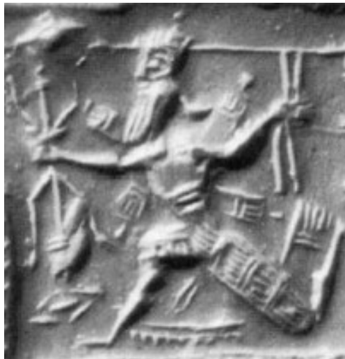
شکل ۲. نینورتای با سلاح سه‌شاخه دو طرفه (William and Moore, 1940, p. XI, fig 95)

می‌شود، عصای سه‌شاخه است که در یک نمونه در دست مردی با پای پرنده در حال دویدن به تصویر کشیده شده است (شکل ۲). برای شناسایی این شخص از اسطوره «انزو» کمک می‌گیریم. اسطوره انزو یکی از داستان‌های حماسی آشوری است که بر اساس آن انزو نگهبان انلیل، لوح‌های تقدیر را از او می‌رباید و برای بازپس‌گیری الواح تقدیر نینورتای مسلح می‌شود و سلاح رعد را از او گرفته است. انزو با بدن انسان و سر عقاب و بال پرنده به تصویر کشیده شده و نینورتای با نماد سه‌شاخه نشان داده شده که در حال جنگ و پیکار با انزو است (هوک، ۱۳۹۹، ص. ۱۷۵-۱۷۶).