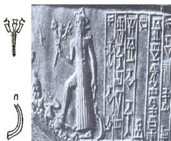
شکل ۹. عصای داسی شکل و عصا با سر شیر در دست نینورتای ایزد جنگ در دوره بابل قدیم

با بررسی مهرهای استوانه‌ای و متون اساطیری نینورتای از دوره بابل قدیم ظاهر می‌شود و ایزد جنگ به‌شمار می‌آید و عصاهای ایشثار را در دست دارد که احتمالاً در این دوره جایگزین ایشثار شده است (شکل ۹).