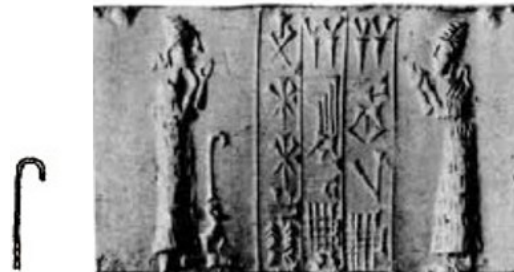
شکل ۴. عصای سرکچ در مهر استوانه‌ای بابل قدیم

در دوره بابل قدیم عصای سرکچ در مهر استوانه‌ای بین یک زن و مرد و در یک نمونه بالای سر یک بز نشان داده شده است که قسمت بالای عصا بر روی شانه شخص نیز دیده می‌شود (شکل ۴). بلک و گرین این را نماد ایزد «آمورو» یا «مروتو» می‌دانند و بیان می‌کنند او همیشه کلاه گردی بر سر دارد و پیراهن بلندی پوشیده است و همراه او الهه عبادت کننده‌ای دیده می‌شود (بلک و گرین، ۱۳۸۵، ص. ۹۵).