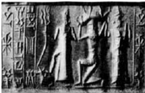
شکل ۲۱: شاه آشور در مقابل عصای سه‌شاخه نماد نینورتای (William and Moore, 1940, p. XI, fig 98)

بدین گونه با بررسی مهرهای استوانه‌ای می‌توان برای نینورتای سه عصا را در نظر گرفت که عبارت‌اند از: ۱ عصای داسی شکل؛ ۲ عصای سر شیر دو طرفه؛ ۳ عصای آذرخش سه‌شاخه، عصای اول و دوم در دوره بابل قدیم و عصای سه‌شاخه در دوره آشور و بابل نو مشاهده می‌شود و حیوان آن اژدرشیر است (بلک و گرین، ۱۳۸۵، ص. ۱۹۵) (شکل ۲۱).