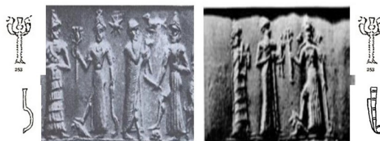
شکل ۸. الف - عصای منتهی به حلقه اینانا و عصای دوسر شیر در دست ایشثار در مهرهای بابل قدیم، ب) ایشثار با عصای داسی و عصای شیر دو سر در دست در مهرهای بابل قدیم

نشان دهنده قدرت و جنگ است (Harris, 1991, p. 270-271, Cabrera). در این دوره، ایشثار جایگزین اینانا شده و به عنوان ایزد بانوی جنگ مطرح می‌شود. با بررسی مهرهای استوانه‌ای بابل قدیم، در دست ایشثار دو عصا مشاهده می‌شود که عبارت‌اند از: ۱- عصای منتهی به حلقه اینانا؛ ۲- عصای دوسر شیر یا عقاب که اولی نماد باروری و دومی نماد قدرت و جنگ است و در تیردان پشت سر، همان سلاح یا عصاها را حمل می‌کند. ایشثار در این دوره لباس دو تکه بالاتنه ضربدری و دامن بلند بر تن کرده است (شکل ۸). در شکل سمت راست گویا ایشثار عصای دوسر با سر شیر یا عقاب را به شخص مقابل خود که لباس بلندی بر تن و کلاه لبه‌دار گردی بر سر دارد تقدیم می‌کند، در پشت سر او ایزدی با لباس چین‌دار و کلاه شاخ‌دار بر سر ایستاده است در حالی که دو دستش را بالا گرفته است. شخص اول با توجه به لباسش ایزد نیست، احتمالاً، با توجه به نوع سرپوش، او حمورابی است. ایزد پشت سر شاه نمادی در دست ندارد تا او را شناسایی کرد، با توجه به اینکه این نمادها از این دوره به بعد در دست نینورتای دیده می‌شود احتمالاً او نینورتای است. در شکل سمت چپ دو صحنه به تصویر کشیده شده است در سمت راست مردوک با توجه به حیوان زیر پایش (اژدرشیر) عصا را به شاه اعطا می‌کند با توجه به پوششش شخص مقابل مردوک او می‌تواند حمورابی باشد. بالای سر آن‌ها پرنده‌ای مشاهده می‌شود. در صحنه دوم ایشثار با عصای دوسر شیر و عصای داسی شکل در دست، شیر در زیر پا و ستاره در بالای سر در مقابل ایزدی با لباس کائولیس مشاهده می‌شود. عصا با سر شیر دو طرفه در دوران بابل قدیم نشان از قدرت دارد که در آشور نو هم دیده می‌شود که نماد جنگ و قدرت بشمار می‌آمده است (کوپر، ۱۳۹۲، ص. ۲۴۳).