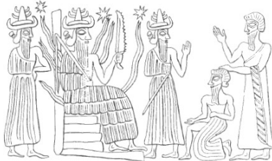
شکل ۱۶. ایزد شمش با ازه دنداندار در دست

با بررسی مهرها، دوشی دیگر در دست شمش دیده می‌شود که به شکل ازه بادندان و یا بی دندان است (شکل ۱۶). در مهر ذیل شمش با پرتوهایی در پشت مشاهده می‌شود که بر روی صندلی نشسته و ازهای را بر دست دارد. در مقابل او یک مرد ایستاده که دستش را بنا به احترام بالا برده‌اند و شخص دیگر در مقابل شمش زانو زده است.