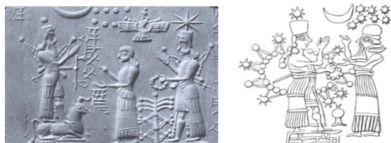
شکل ۱۲. ایشثار بر روی مهرهای استوانه‌ای آشور نو بنام ماه و ستاره و هفت دایره (William and Moore, 1940, p. XI, fig 80)

از دوران کاسی در برخی از نمونه‌ها، زن برهنه‌ای به تصویر کشیده شده که هیچ نمادی در دست ندارد ولی در مهرهای استوانه‌ای آشور نو دوباره شاهد نمایش زنی هستیم که لباس بلند چاک‌داری بر تن و کلاه استوانه‌ای بر سر دارد که بالای سر آن ستاره هشت‌پر و در دستش حلقه‌ای از سنگ مشاهده می‌شود که شبیه تسبیح و در برخی از مهرها دورتادور او را حلقه‌ای از ستاره در برگرفته است. همچنین در بالای سر او هفت کره کوچک به‌طور مکرر در فضای مهرها دیده می‌شود که صور فلکی را نشان می‌دهند و از نظر ستاره‌شناسی با گروه ستاره‌های هفت خاوه‌ر در ارتباطند و یا نشان دهنده هفت خدا است (بلک و گرین، ۱۳۸۵، ص. ۲۶۵) (شکل ۱۲). منشأ هفت خدا به همراه خواهرشان نرودو، احتمالاً، عیلامی است و با الهه نرونته مرتبط می‌باشند (بلک و گرین، ۱۳۸۵، ص. ۲۶۹).