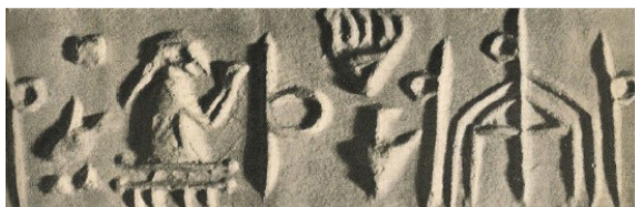
شکل ۲. اینانا همراه با عصا و حلقه در کنار کلبه مقدس (Frankfort, 1939, p. pls VII)

بررسی مهرهای استوانه‌ای سومر قدیم نشان می‌دهد ایند بانوی اینانا در مهرها همراه با حلقه و عصا در کنار کلبه مقدس نشان داده شده‌اند (شکل ۲). از سویی بخش دوم اسطوره اینانا به ازدواج اینانا و دوموزی اشاره می‌کند (کریم، ۱۳۸۵، صص. ۱۲۳-۱۲۵) که به ازدواج مقدس معروف است. از این رو، احتمالاً، نماد حلقه و عصا در کنار کلبه مقدس نشان پیمان و باروری محسوب می‌شود.